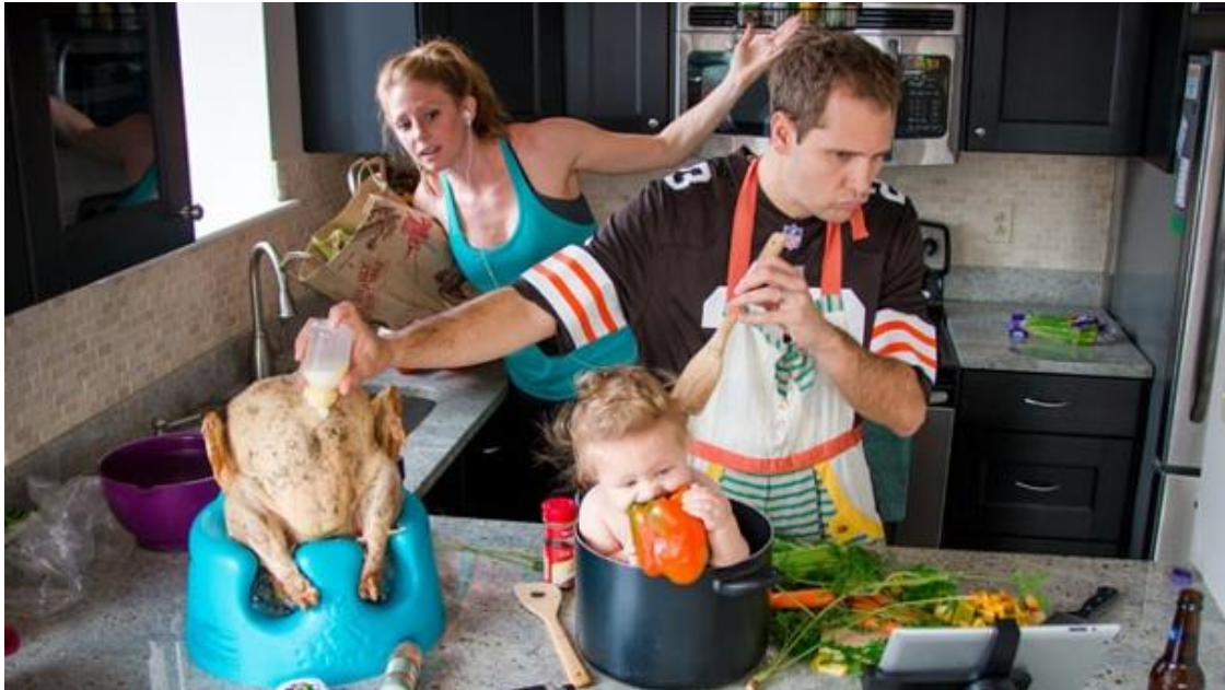
"Immer einen kühlen Kopf bewahren" – Foto: Danielle Guenther